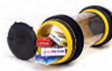
Léky, jednodávky „UNIT DOSE“