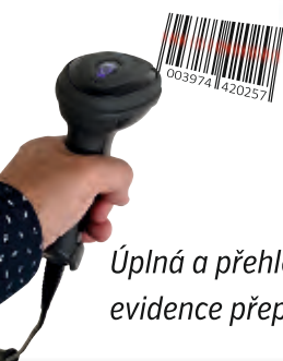
Úplná a přehledná evidence přepravy