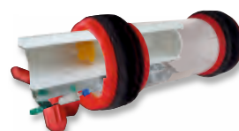
Cytostatika ve speciální vložce