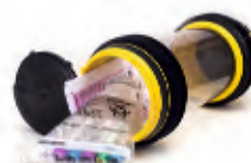
Různé další materiály