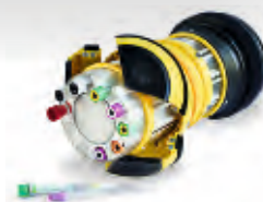
Různé typy zkumavek různých výrobců