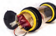
Transfuzní přípravky - plazma, krev