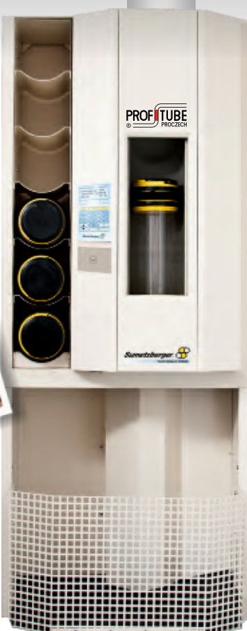
nejmodernější stanice pro nemocniční oddělení